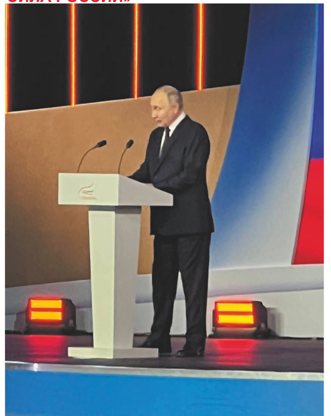
Форум «МАЛАЯ РОДИНА - СИЛА РОССИИ» был организован Всероссийской ассоциацией развития местного самоуправления (varmsu.ru) при поддержке Администрации Президента Российской Федерации.

«Быть готовыми сплотиться в моменты исторических вызовов, делать все для счастья и благополучия родной страны и сограждан — в этом и есть смысл служения Родине», - подчеркнул Владимир Владимирович Путин на церемонии вручения всероссийской муниципальной премии «Служение».